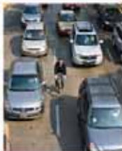
Cuando el flujo está congestionado puedes tratar de ubicarte entre los coches.

MANUAL DEL CICLISTA DE LA CIUDAD DE MÉXICO