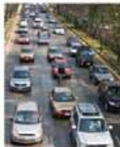
En el segundo carril, adelante a los automovilistas más atentos.

CUANDO QUIERAS DAR VUELTA A LA IZQUIERDA, ES MEJOR POSICIONARTE POCO A POCO HACIA ESE EXTREMO.