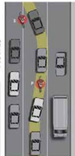
Posición primaria y posición secundaria de circulación en bicicleta.