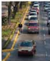
En el carril derecho, adelante por un momento para las automovilistas más atentas.